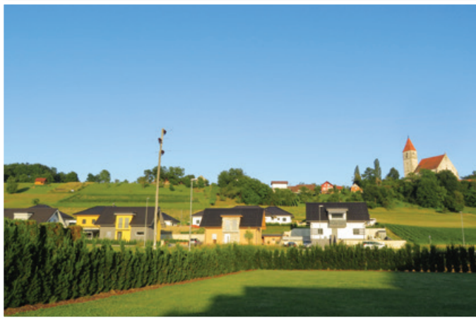
Številne investicije dajejo Občini Benedikt novo, sodobno podobo.

vožite«. Prejela ga je tudi Občina Benedikt. Na razpis se je sicer prijavilo kar 41 občin. Prikazovalniki hitrosti so se že v preteklosti izkazali kot učinkovito sredstvo za takojšnje