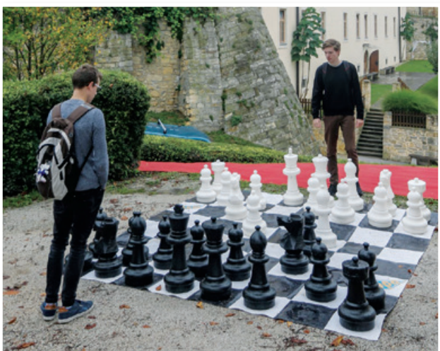
Igranje vrtnega šaha

la najboljšo kratko zgodbo na temo Šah mat ali kralj je mrtev z naslovom Še zadnja dva.