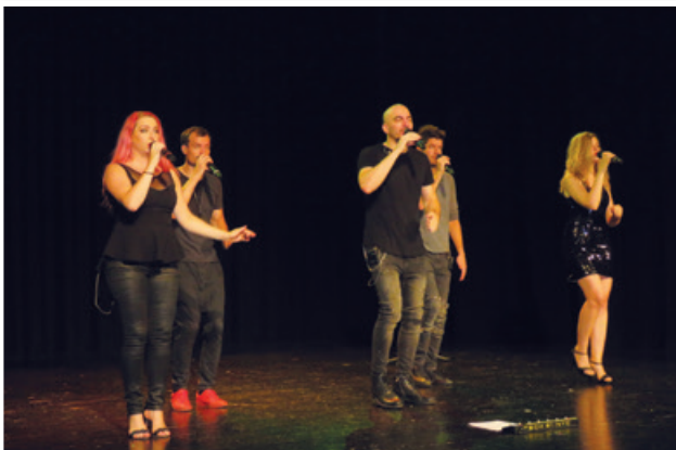
Vokalna skupina Bassless, foto Tomaž Ornik