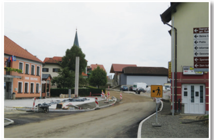
Središče Cerkevjaka že dobiva novo podobo.

vzdrževanje občinskih cest in javnih poti, ki jih je na območju Občine Cerkevjak okoli 80 km. Na letni ravni po besedah župana Žmavca občina iz proračuna za to nameni preko 100 tisoč evrov.