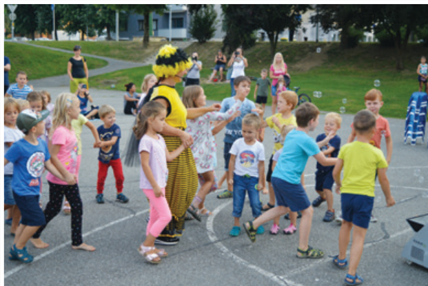
Počitniške vragolije Čebele Počasne