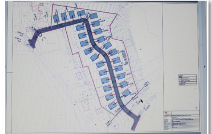
Iz občinskega podrobnega prostorskega načrta je razvidno, da je v novem stanovanjskem naselju v Lokavcu 26 parcel za stanovanjsko gradnjo.