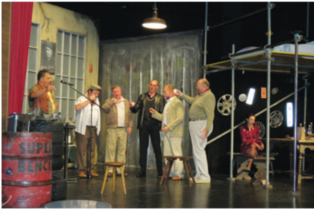
Petelinji zajtrk