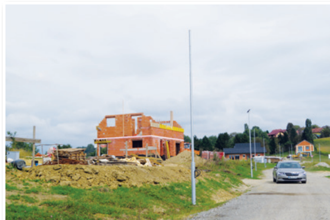
V novi soseski Trojica jug intenzivno poteka izgradnja komunalne opreme, posamezni investitorji pa že gradijo stanovanjske objekte.

V novi stanovanjski soseski Trojica jug, ki