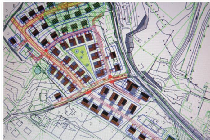
V soseski Trojica jug bo našlo novi dom predvidoma od 180 do 240 ljudi.

Kot pravi župan Klobasa, se občina ne more izogniti velikim enkratnim stroškom za izgradnjo komunalne opreme v celotni novi soseski, saj si vsi različni lastniki parcel želijo, da bi lahko začeli graditi. Gledano z vidika stroškov bi bilo bolj racionalno, če bi občina gradila komunalno opremo po fazah glede na pozidavo, vendar pa mora enakopravno upoštevati interese