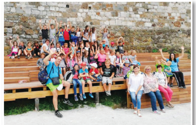
Počitniški izlet v Ljubljano, ki ga je organiziralo Društvo prijateljev mladine Slovenske gorice