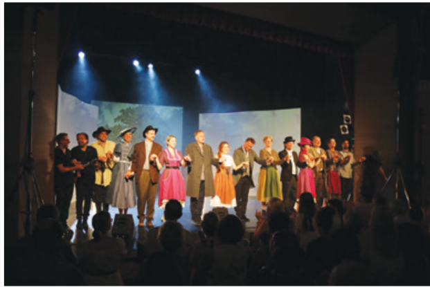
Cvetje v jeseni