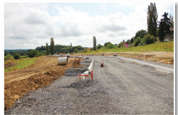
Novo oziroma bodoče stanovanjsko naselje v Lokavcu je že komunalno opremljeno.