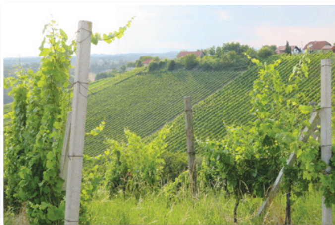
Turiste, še zlasti v tem jesenskem času, v Občino Sveta Ana vabijo tudi čudovite vedute osrednjih Slovenskih goric, ki so posejane z vinogradi.