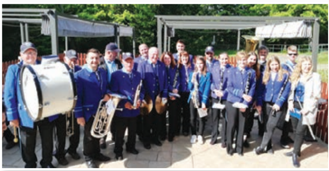
Pihalni orkester Apače

Praznični prvomajski dnevi so se v Varovanem domu Ščavnica v Občini Sveta Ana začeli z glasbo. Takoj po zajtrku jih je presenetil obisk Pihalnega orkestra Apače. S prvomajsko budnico so prebudili prav vsakega, stanovalke in stanovalce kot tudi zaposlene so navdušili z igranjem znanih melodij, ob katerih so tudi zaplesali in navdušeno ploskali. Praznični dan je minil ob številnih obiskih svojcev, ki so popestrili domsko dogajanje. Ker jim je bilo vreme naklonjeno, so ga izkoristili za peko pleskavic na žaru na terasi doma. Člani pihalnega orkestra so nam obljubili ponovno snidenje prihodnje leto in povedali, da jih po vaseh