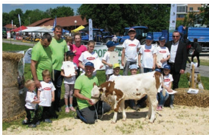
Udeleženci in organizatorji prireditve LISKA