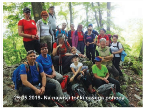
25.05.2019. Na najvišji točki našega pohoda

V vasi Grmače nad Moravčami smo izstopili, se pripravili za pohod in po dvajsetih minutah prispeli do Planinskega doma »Ušte-Žerenk«. Od tu je bil prekrasen razgled na moravško dolino, tja do Kamniških Alp. Tudi postrežba je bila prijazna in kvalitetna, kar manjka marsikateremu gostinskemu lokalu. Nadaljevali smo mimo »ranča« Osole, kjer so nas pozdravili konji ter različne pasme kozic. V nadaljevanju smo prešli na južno stran hribovja, kjer so se nam začeli odpirati pogledi na savsko dolino. Najlepši razgled se nam je ponudil nad kresniškim kamnomlomom, kjer lomijo kamen za proizvodno apna v vasi Kresnice na desnem bregu Save. Na samo vas in dolino reke Save, tja do Litije, se nam je odprl pogled z vzletišča za jadralna padala. Na najvišji točki pohoda, na 880 m