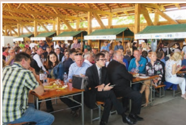
V sejemskem šotoru je bilo vedno živahno, še posebej ob otvoritvi sejma.