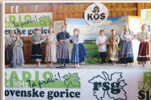
Na otvoritvi sejma so najmlajši izvedli prisrčen kulturni program.