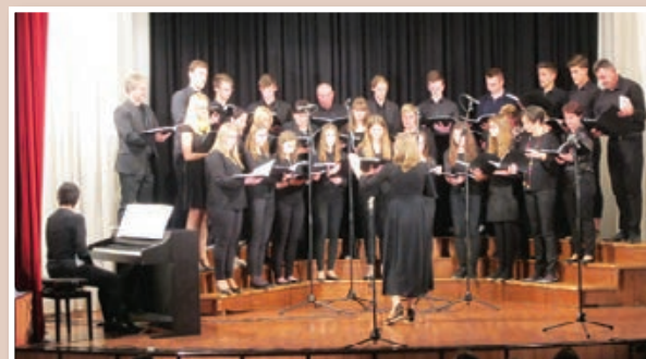
Cerkevno-prosvetni pevski zbor KD Sv. Ana