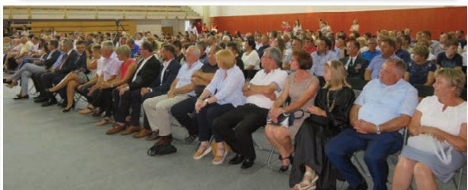
Benedikt praznuje 20. občinski praznik od 28. junija do 13. julija. Na osrednji proslavi je govoril predsednik DZ RS mag. Dejan Židan. Str. 3