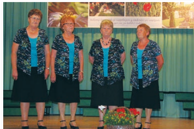
Ljudska pesem je doma tudi v Lenartu, kjer jo neguje skupina pevka pod okriljem DU Lenart.