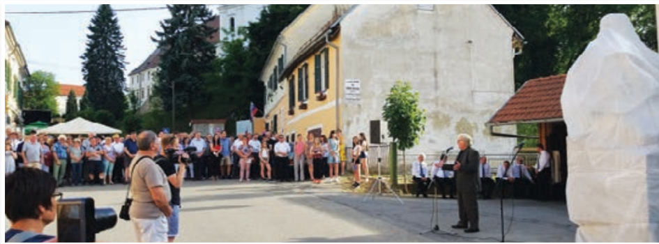
Prireditve ob trojiškem občinskem prazniku so se zile v Trojicafest od 7. do 16. junija, ena osrednih pa je bilo odkritje spomenika Ivanu Cankarju. Str. 8