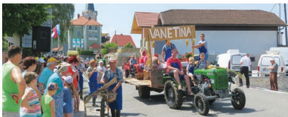
V Cerkvenjaku so občinski praznik praznovali od 31. maja do 1. julija. V ospredju je bila tudi tokrat tradicionalna povorka starih običajev. Str. 4