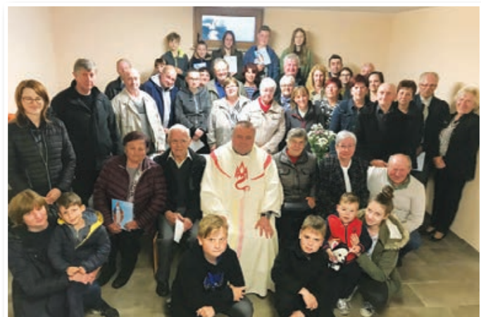
Utrine z zaključnega druženja na domačiji Vuzem