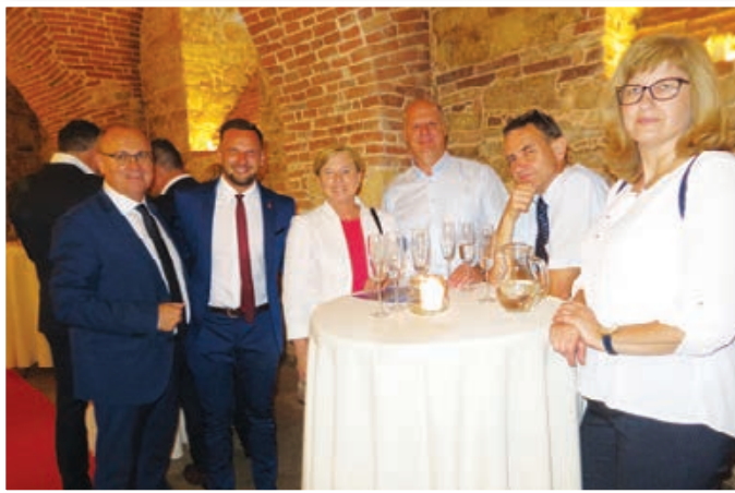
Otvoritve Trojicafesta so se udeležili številni ugledni gosti, ki so se pred otvoritvijo zbrali v samostanski kleti.