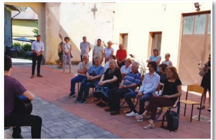
Dvorišče Galerije Dani je prijeten ambient za prireditve.