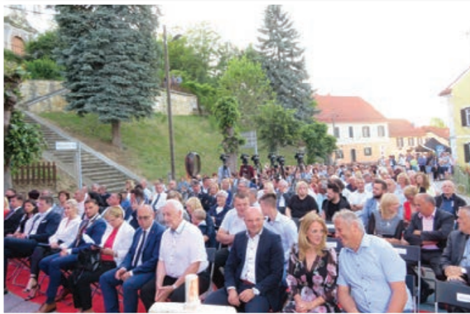
Otvoritvena slovesnost Trojicafesta je potekala v čudovitem ambientu na Trojiškem trgu v središču Svete Trojice, kar ji je dalo še poseben čar.