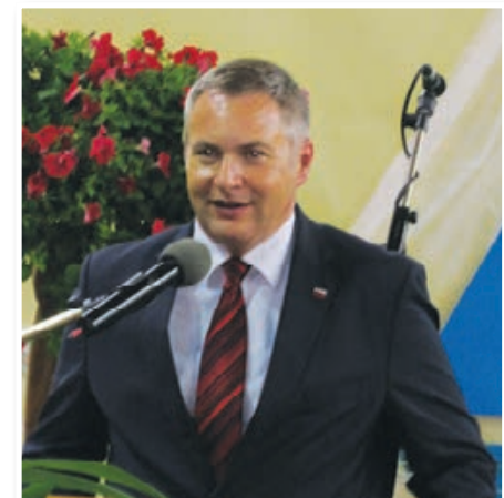
Slavnostni govornik na proslavi je bil mag. Dejan Židan, predsednik Državnega zbora Republike Slovenije.