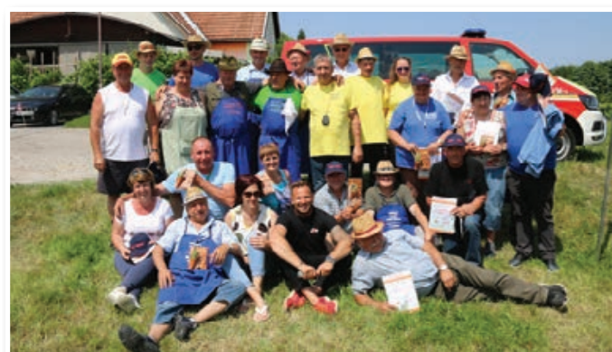
Tekmovalci z organizatorji, sodniki in županom