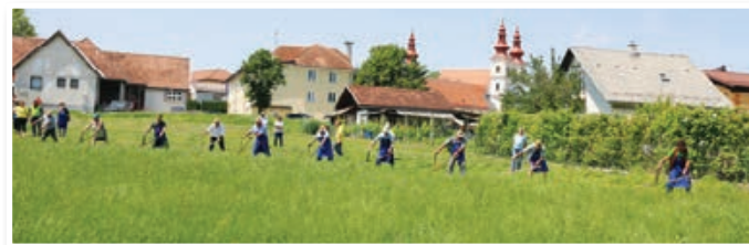
Skupinska košnja, košnja na »štraf«