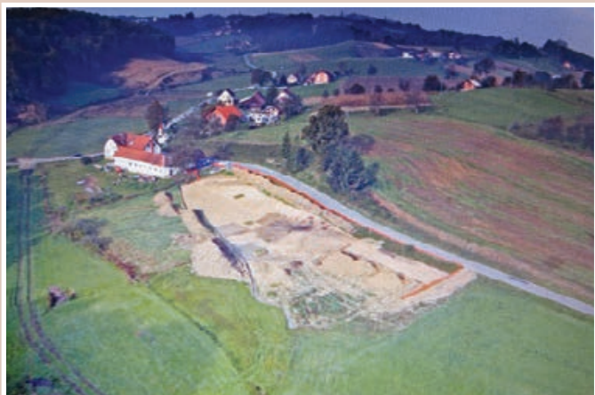
Na tej lokaciji za Gostilno pri Mileni, ki so jo morali zaradi gradnje avtoceste podreti, je konec 4. in v prvi polovici 5. stoletja stal pozno antični lončarski obrat, v katerem so proizvajali lončenino za hišno rabo (danes bi rekli za široko potrošnjo).