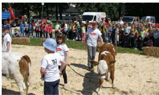
Maneža Liska z najmlajšimi rejci