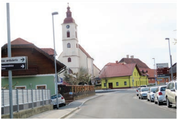
Turistična destinacija Sveta Ana, ki se od začetka poletja ponaša s certifikatom »Slovenia Green Destination Silver«, je ena najlepših turističnih destinacij v Osrednjih Slovenskih goricah in nasploh v severovzhodni Sloveniji.