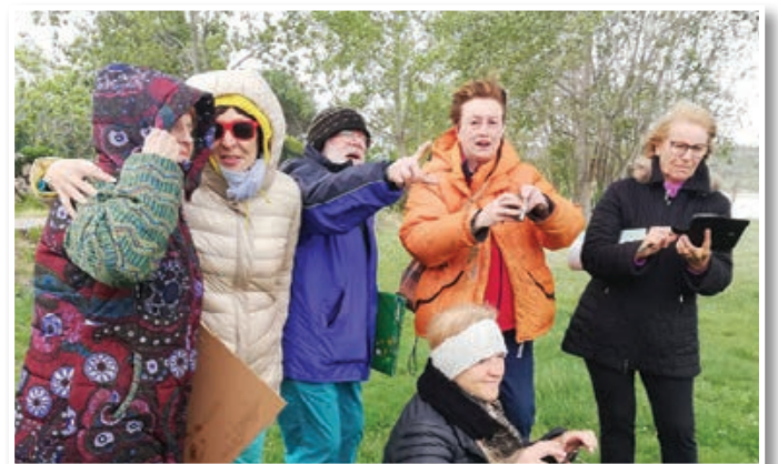
Na obali, pihala je burja ...