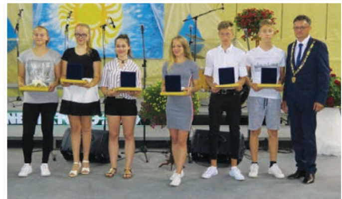
Najbolj uspešni učenci in učenke so prejeli »Županovo petico«.