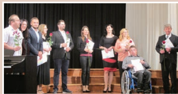
Podelitev priznanj Orfejeva pesem