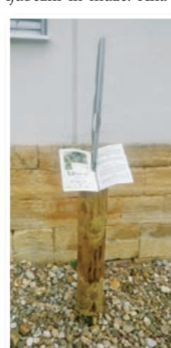
Točka Ana Lušin ob OŠ Benedikt

Pohod je bil v tokratni izvedbi osnovan na dejstvu, da so leta 1910 učenci iz Benedikta odšli v Sv. Trojico, da bi videli Ivana Cankarja, ki je takrat bival pri Alojzu Kraigherju. Drugi razlog pa je bilo Cankarjevo pešačenje v Benedikt, kamor se je odpravil neke noči, da bi poiskal Anin grob, grob svoje edine prave ljubezni in muze. Ana Lušin je medtem že počivala na pokopališču Plešivec, kjer je učiteljevala do svoje smrti.